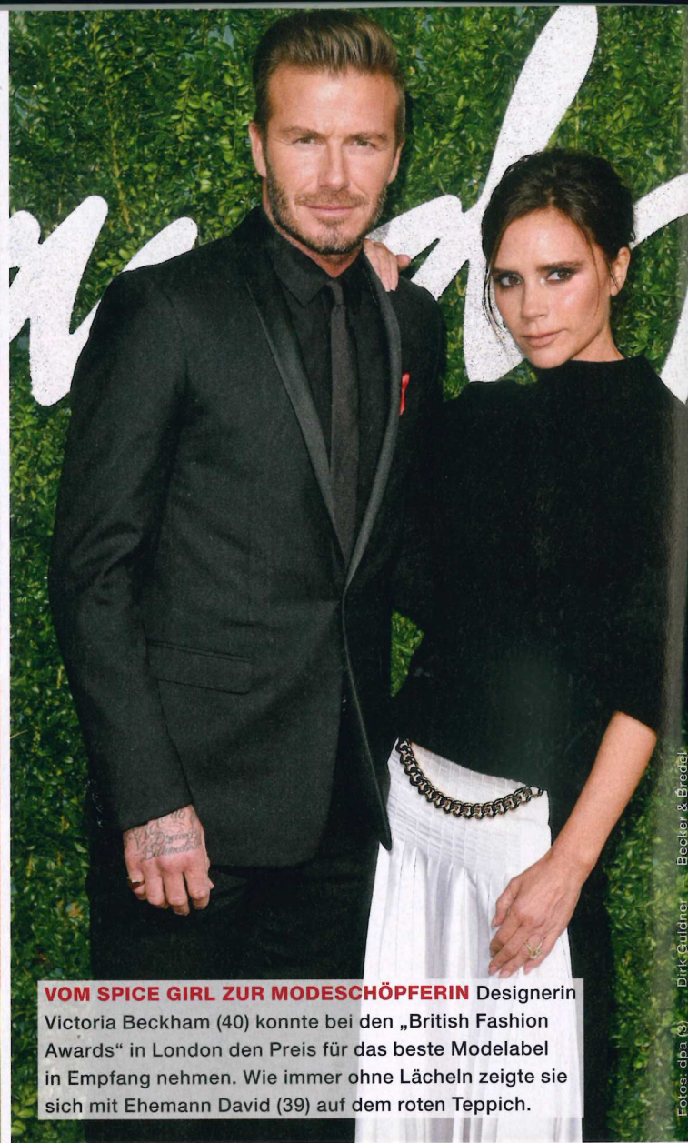
VOM SPICE GIRL ZUR MODESCHÖPFERIN Designerin Victoria Beckham (40) konnte bei den „British Fashion Awards“ in London den Preis für das beste Modelabel in Empfang nehmen. Wie immer ohne Lächeln zeigte sie sich mit Ehemann David (39) auf dem roten Teppich.