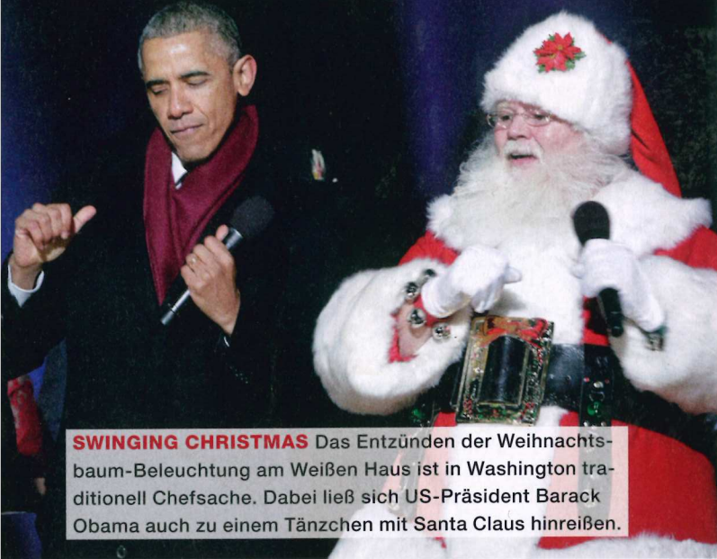
SWINGING CHRISTMAS Das Entzünden der Weihnachtsbaum-Beleuchtung am Weißen Haus ist in Washington traditionell Chefsache. Dabei ließ sich US-Präsident Barack Obama auch zu einem Tänzchen mit Santa Claus hinreißen.